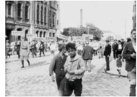
Das dritte Volksfest des Republikanischen Schutzbundes der Ortsgruppe XVI (1925, anonym)

Amateur-Filmemacher*innen halten seit inzwischen über 100 Jahren besondere Momente ihres Lebens fest, auch im Öffentlichen Raum – und dort mit besonderer Brisanz, liefern ihre Bilder doch häufig Gegenbilder zu den dominanten Erzählungen in Zeitgeschichte und politischer Identitätsbildung. Diese »rohen« Filmbilder sind aber nicht einfach zu lesen, lassen sich nie auf einfache Aussagen reduzieren und öffnen