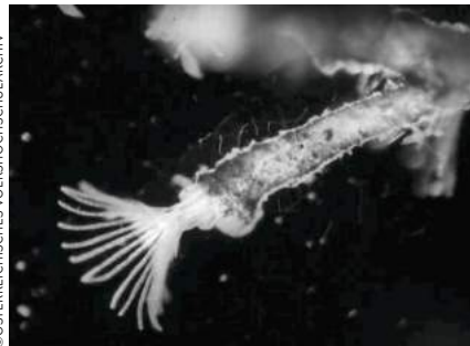
Welt des Unsichtbaren (1957, Ann H. Matzner)

Anhand von Chaplins Filmen zeigt sich, wie Kino nicht nur lustig, sondern auch politisch sein kann. Wie es Gesellschaftskritik übt