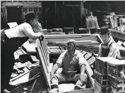
Busy Bodies (1933, Lloyd French)

Clowns und Pioniere des Films, die stets auf der Suche nach dem perfekten Gag waren und dabei sogar ihr Leben riskierten. Sie werden auf der ganzen Welt verehrt, ihre Gags und Techniken sind bis heute nicht nur für den komischen Film von Bedeutung. In Filmausschnitten von damals und heute wird gezeigt, wie Filmkomiker arbeiten, wie sie ihren Körper und die Filmtechnik einsetzen, um uns zum Lachen zu bringen.