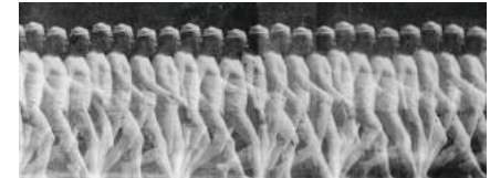
Homme qui marche (ca. 1883, © Étienne-Jules Marey)

Wie Kino eigentlich funktioniert, bleibt uns zumeist verborgen: Wir sehen die bewegten Bilder auf der Leinwand, aber nicht ihren Ursprung – den Projektor, die Einzelbilder auf dem Filmstreifen, die Tonspur. Und vieles, was wir zwar sehen könnten, ist uns gar nicht bewusst – die verschiedenen Bildformate, die Rollenwechsel zwischen den einzelnen Akten, die Arbeit des*der Projektionist*in. In dieser Lecture wird in kleinem Kreis erkundet, wie das Kino funktioniert, welche Hebel bewegt, Scharniere verschoben und Handgriffe getätigt werden, wenn die Kino-Maschine in Betrieb geht. (ab)