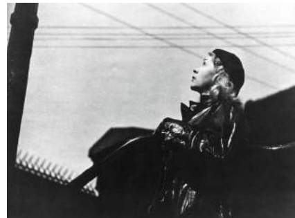
The True Story of Lili Marlene (1944, Humphrey Jennings)