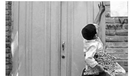
Nan va Kucveh (Brot und Gasse, 1970, Abbas Kiarostami)

MONTAG, 20. JUNI 2022, 10-12 UHR 6 BIS 9 JAHRE