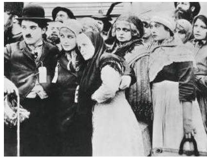
The Immigrant (1917, Charles Chaplin)

und – zumindest als Utopie – Wege zeigt, wie Schwächere sich gegenüber den Stärkeren behaupten können. (nu & nz)