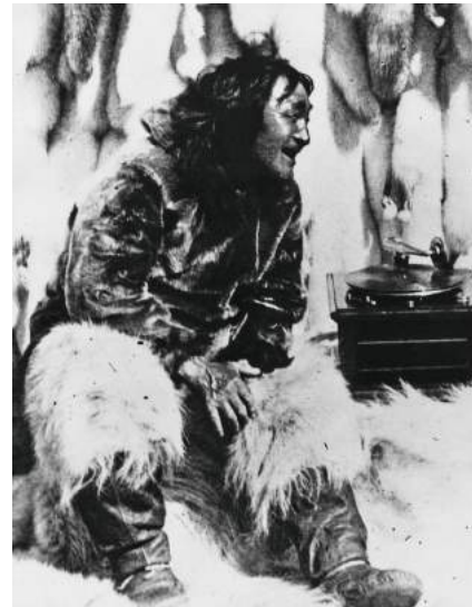
Nanook of the North (1922, Robert J. Flaherty)