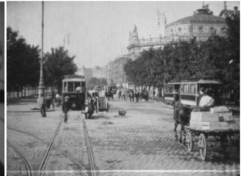
Vienne en tramway (1906, Pathé Frères) Ganzer Film unter: http://stadtfilm-wien.at/film/47/