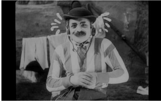
Wo sind die Millionen? (1925, Robert Wohlmut) Ganzer Film unter: http://stadtfilm-wien.at/film/31/

Am besten eignen sich dafür Stummfilme, hier sind einige aus unseren Sammlungen, die sich für eine Vertonung eignen könnten: